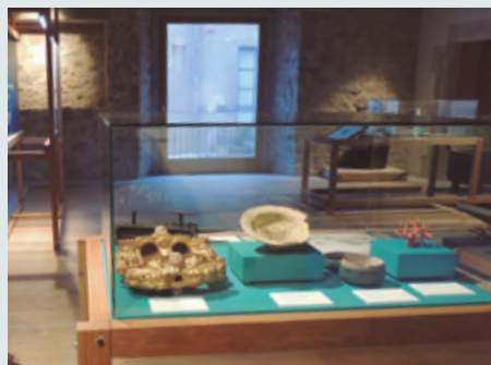
Sales de l'exposició "L'Escala i la Mar d'Empúries"