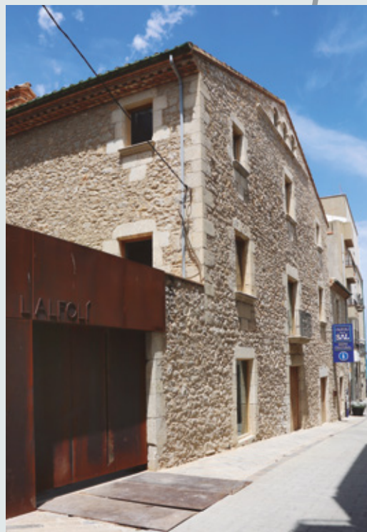
L'Alfolí de la Sal, s. XVII

L'edifici de l'Alfolí de la Sal va ser construït el 1697 a l'antic port de l'Escalà. A partir de 1716 va ser el magatzem reial de la sal, que arribava en vaixells de cabotatge per distribuir-la a més de dos cents pobles de les comarques veïnes. Més tard fou seu d'associacions de pescadors i d'indústries de salaó. A la dècada de 1970 va començar una intensa campanya de defensa popular, fins que l'any 2003, la Generalitat de Catalunya el va declarar Bé Cultural d'Interès Nacional. L'any 2017 es va inaugurar com a Museu de l'Escalà per conservar i difondre el seu patrimoni cultural i natural.